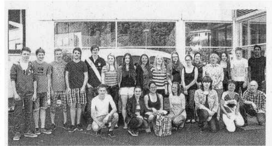
Die Schüler der beiden Idar-Obersteiner BBS erfuhren beim Gastspiel des France Mobils aus erster Hand einiges über die französischen Nachbarn.

Die Fortgeschrittenen hingegen errieten Produkte französischer Werbung und erfanden später sogar selbst lustige Werbetexte für französische Produkte wie einen Camembert oder ein Tafelwasser. Abschließend lässt sich festhalten, dass alle Französischschüler mit einer echten Französin ins Gespräch kamen. Sie konnte ihnen zeigen, wie spannend, jung und dynamisch Frankreich sein kann.